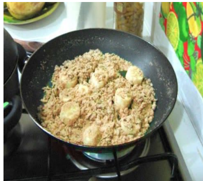
Farofa de banana