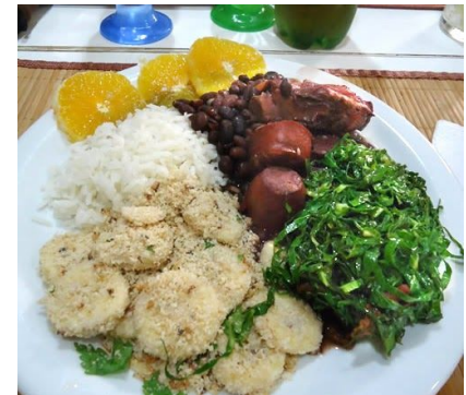
* Feijoada completa