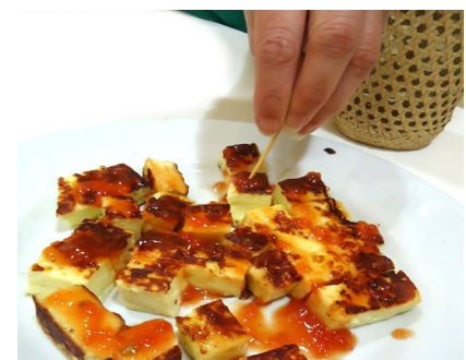
Queijo coalho com geleia de pimenta

* Podemos fazer moqueca e feijoada vegetariana para parte do grupo.